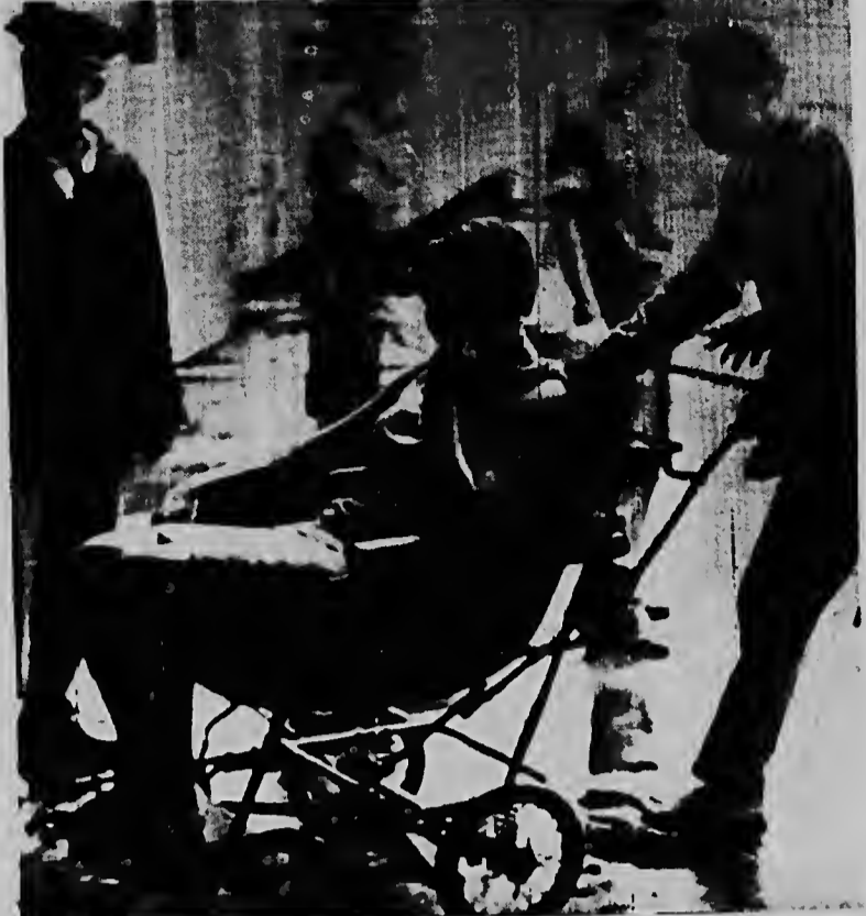
Visiblemente confuso despues di a ser rescatá, e sobreviviente aki di e avion Caravelle cu a caiden bahia di Hong Kong, ta ser transporta pa hospital di Hong Kong despues cu nan a saquele huntu cu hopi pasahero